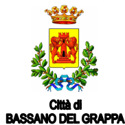
Città di BASSANO DEL GRAPPA

2. L'allestimento della mostra e la pubblicazione del catalogo saranno a cura esclusiva dei soggetti organizzatori.